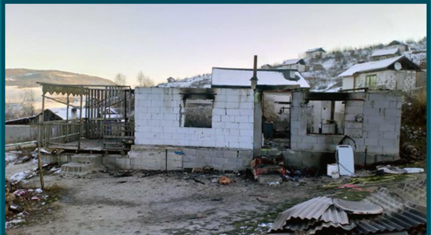
The remains of the home in which a mother and her four young children died after it caught fire on 30 November 2018.

Nach dem TRAGISCHEN TOD EINER ROMNI UND IHRER VIER TÖCHTER in der Slowakei machte sich der Rassismus in den Kommentarspalten von Online-Medien Luft. Auch auf der Facebook-Seite der Polizei. Diese kündigte an, gegen die Verfasser_innen vorzugehen.